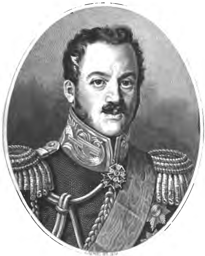
ПАВЕЛЪ ДМИТРИЕВИЧЪ КИСЕЛЕВЪ