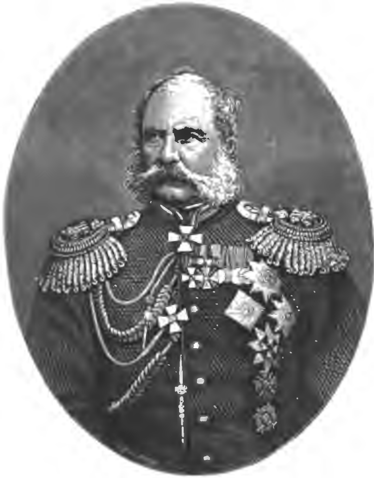
КНЯЗЬ АЛЕКСАНДРЪ ИВАНОВИЧЪ БАРЯТИНСКІЙ